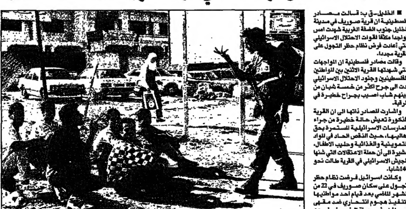
جندي يتحدث فلسطينيين عن حاجز اسرائيلي

غزة - ات به أعلنت شركة الطيران الفلسطينية ان رحلاتها الجوية ستبدأ قريبا الى القاهرة وعمان وقبرص واسطنبول وجدة.